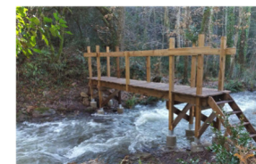
Passerelle du Linon